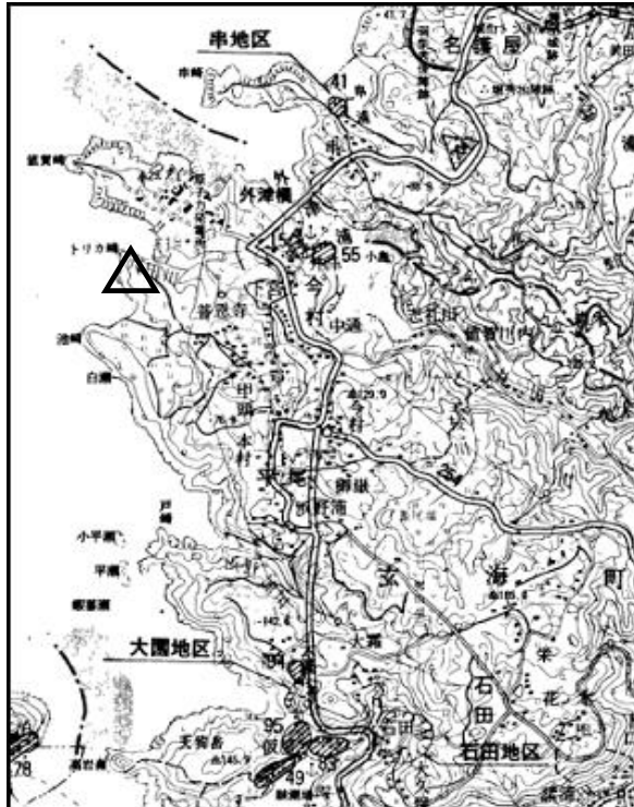
要図 1/50,000 呼子

備考 平成18年10月19日 新設 柱石長 0.01m GPS測量による 現況地目：公衆用道路