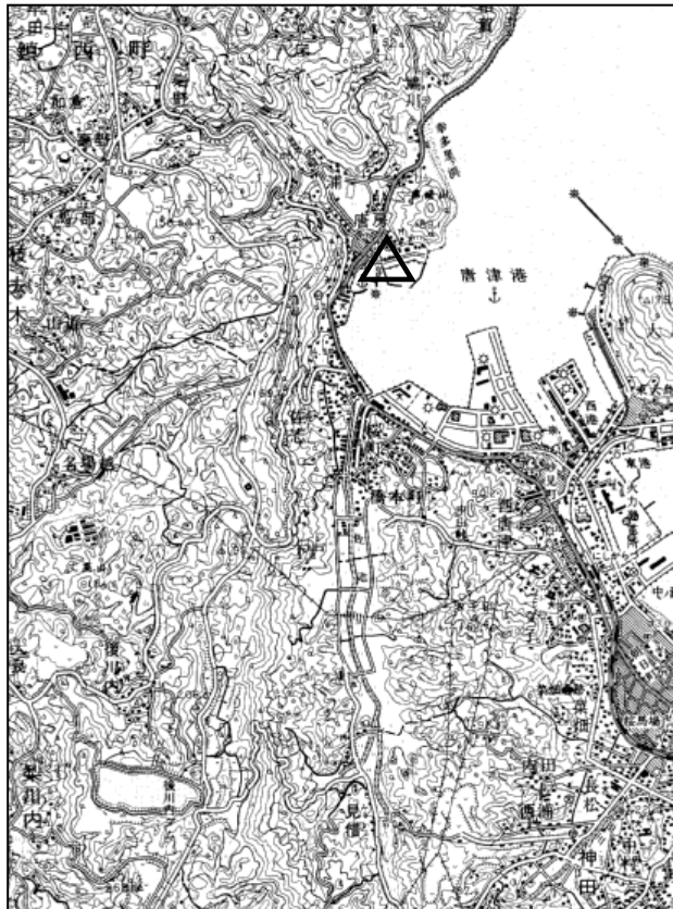
要 図 1/50,000 唐津

備考 平成18年10月20日 新設 柱石長 0.01m GPS測量による 現況地目：公衆用道路