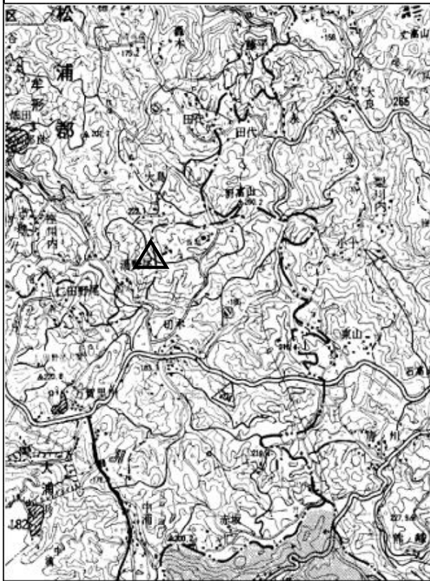
要 図 1/50,000 唐津