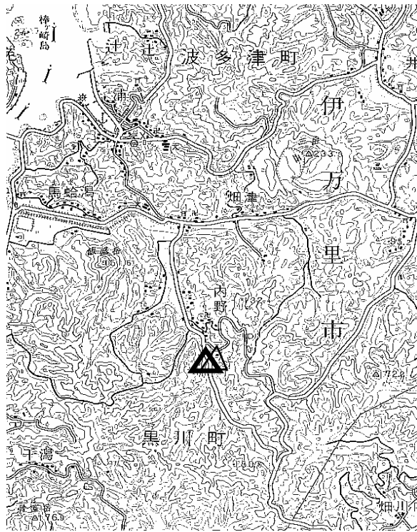
要 図 1/50,000 唐津

備 考 平成18年11月 7日 新設 柱石長0.01 GPS測量による 現況地目：河川