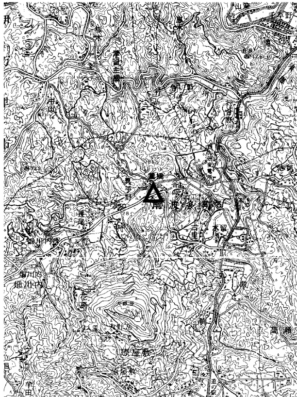
要図 1/50,000 唐津

備考 平成18年10月24日 新設 柱石長 0.01m GPS測量による 現況地目：公衆用道路