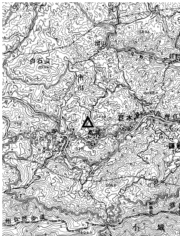
要 図 1/50,000 浜 崎