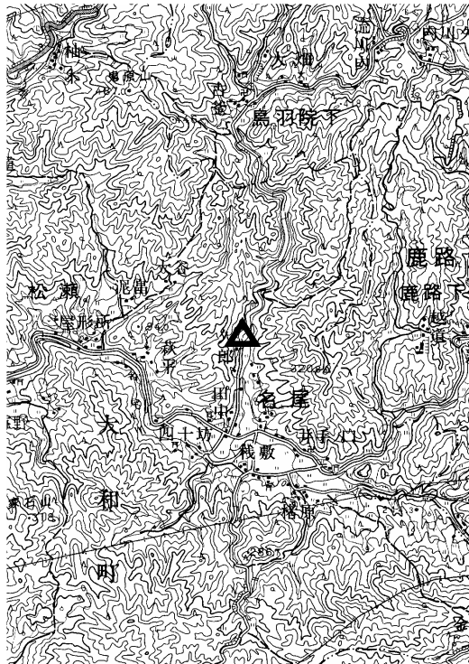
要 図 1/50,000 背振山

備考 平成18年10月7日 新設 柱石長 0.01m GPS測量による 現況地目：公衆用道路