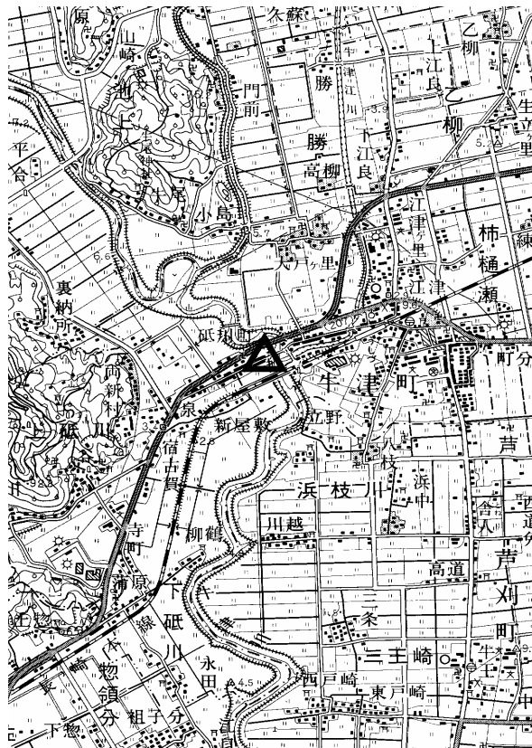
要図 1/50,000 武雄

備考 平成18年10月8日 新設 柱石長 0.01m GPS測量による 現況地目：河川