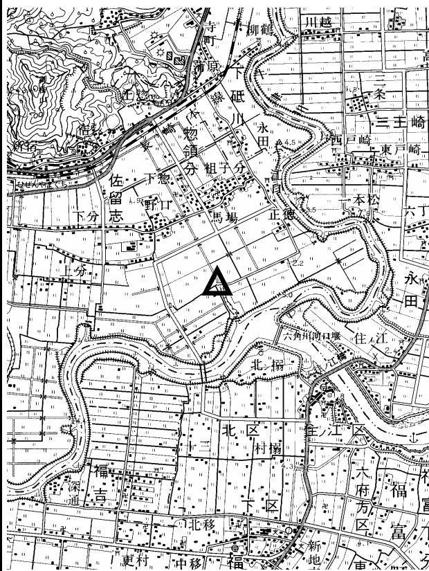
要 図 1/50,000 武雄

備考 平成18年9月28日 新設 柱石長 0.01m GPS測量による 現況地目：公衆用道路