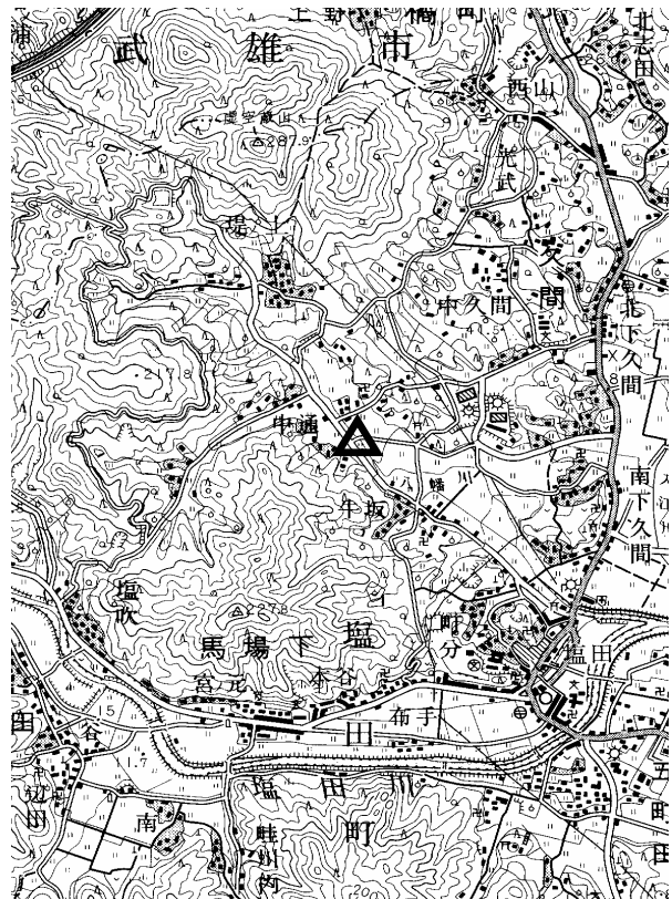
要 図 1/50,000 鹿 島

備考 平成18年9月15日 新設 柱石長 0.01m GPS測量による 現況地目 : 公衆用道路