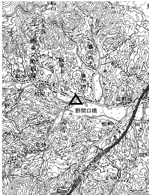
要 図 1/50,000 武雄

備考 平成18年10月9日 新設 柱石長 0.01m GPS測量による 現況地目：公衆用道路