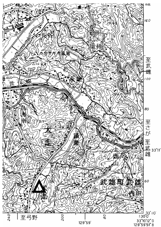
要 図 1/50,000 伊万里

備考 平成18年9月23日 新設 柱石長 0.01m GPS測量による 現況地目：河川敷