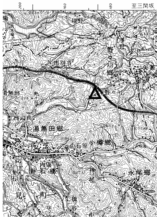
要図 1/50,000 早岐

備考 平成18年9月23日 新設 柱石長 0.01m GPS測量による 現況地目：水路敷