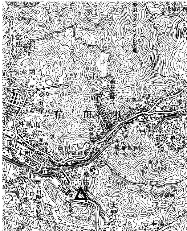
要 図 1/50,000 伊万里

備考 平成18年10月27日 新設 柱石長 0.01m GPS測量による 現況地目：公衆用道路