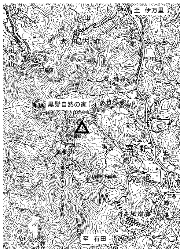
要図 1/50,000 伊万里

平成18年10月8日 新設 柱石長 0.60m GPS測量による 現況地目：公園