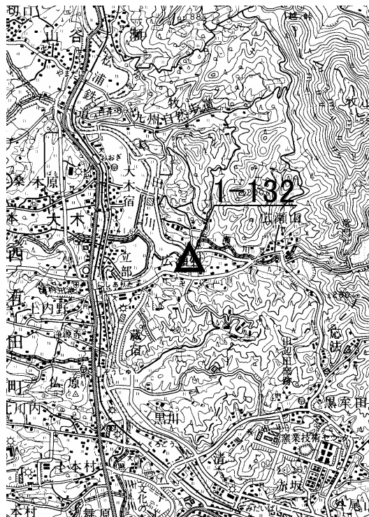
要 図 1/50000 伊万里

備考 平成 18 年 10 月 22 日 新設 柱石長 0.01m 測量方法：GPS測量による 現況地目：公衆用道路