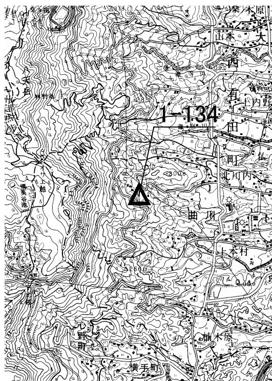
要 図 1/50000 伊万里

備考 平成 18 年 10 月 22 日 新設 柱石長 コンクリート杭 0.60m 測量方法：GPS測量による 現況地目：公衆用道路