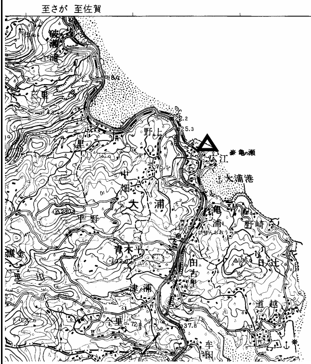
要図 1/50,000 諫早

備考 平成18年9月25日 新設 柱石長 0.01m GPS測量による 現況地目：堤防