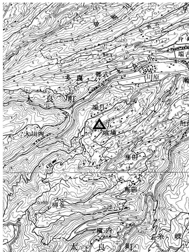
要図 1/50,000 鹿島

備考 平成18年9月25日 新設 柱石長 0.01m GPS測量による 現況地目：ため池